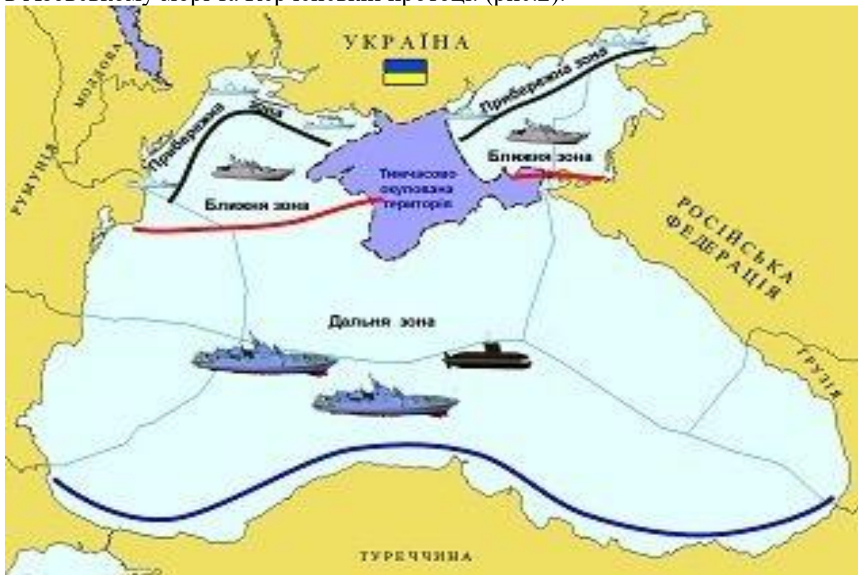
Рис.2. морські операційні зони

Більш детально зупинимось на напрямку “бойові дії та озброєна боротьба”, оскільки цей напрямок тісно пов’язаний із виконанням завдань щодо відбиття агресії, яка ведеться по відношенню до України з боку РФ. Виходячи із вищезазначених загроз з морського напрямку та враховуючи положення АЖР-3.1